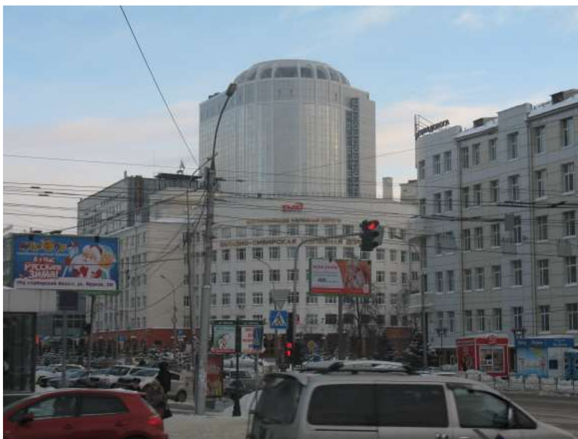
Современное состояние. 2014г. Дворовое пространство занимает бизнес-центр, построенный в охранной зоне памятника, который доминирует над зданием управления.

Несмотря на закреплённые в нормативно-правовых актах Российской Федерации положения о необходимости соблюдения требований по сохранению